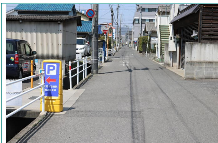
▲病院南側、のがみ屋さんの筋、福本地所さん管理の土地をお借りし、臨時駐車場にいたしました。 [写真:多治米側からバス通り・病院方向を望む]

なお、第1、第3駐車場は24時間営業、臨時駐車場は、午後10時~翌午前8時まで、施錠しております。