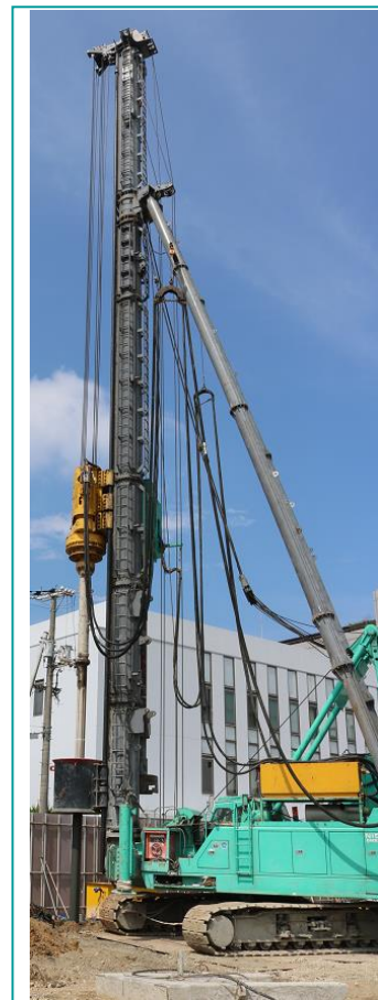
▲杭打ち機。最大で30mの高さになります。